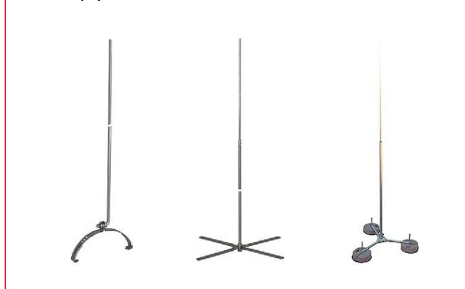
Фото 1. Примеры молниеприемников и мачт из каталога фирмы DEHN+SÖHNE

Обратимся к каталогам ведущих фирм, которые специализируются на производстве современных средств молниезащиты. Так, в подробнейших каталогах компании DEHN+SÖHNE собрано все, что нужно для устройства внешней и внутренней молниезащиты, в том числе разнообразные молниеприемники и соединительные шины для монтажа на крыше здания. Маркетологи фирмы хорошо знают рынок и наверняка комплектуют ассортимент, гарантирующий успешные продажи. Что же известно маркетологам, но ускользает от внимания составителей нормативов по молниезащите?