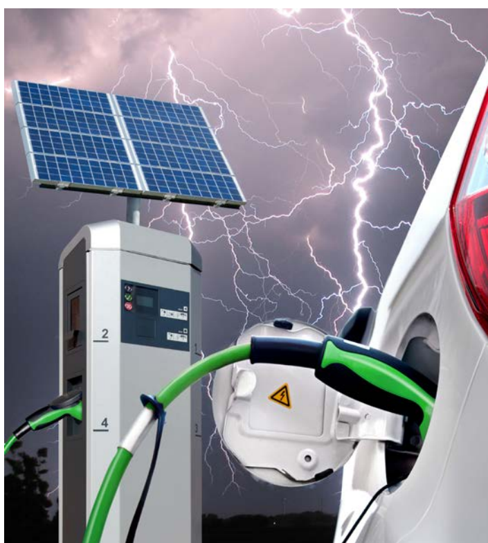
Fig 1 : Véhicule devant une station de recharge

L'espace disponible dans les stations de recharge est souvent limité. Le parafoudre compact DEHNshield est la protection idéale contre les surtensions. En plus de ses dimensions compactes, il est, grâce à ses éclateurs, en mesure de protéger des équipements terminaux.