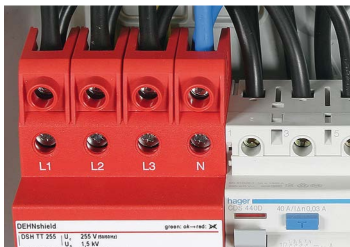
Fig 2: DEHNshield® avec bornes STAK 25

En plus de la réduction des coûts et d'espace, ce type de raccordement présente encore deux avantages. Le premier, le parafoudre est installé à l'endroit où il a un effet optimal. Le second, l'utilisation des bornes de raccordement STAK 25 permet un câblage CEM optimisé selon CEI 60364-5-53.