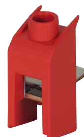
STAK 25 Borne