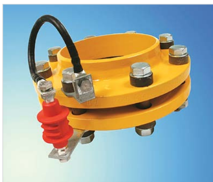
Рис. 4 — Пример шунтирования изолирующего фланцевого соединения с помощью разделительного искрового разрядника EXFS 100

применения на наземных участках трубопроводов. Для удобства его монтажа предлагаются плоские и угловые крепежные скобы из оцинкованной стали с различными диаметрами отверстий под шпильку фланцевого соединения, а также медные соединительные проводники длиной 100, 200 или 300 мм в комплекте с кабельными наконечниками. Разрядник EXFS 100 KU более универсален и может применяться как для наземного, так и подземного монтажа за счет специальной водонепроницаемой оболочки. В состав конструкции входят также два соединительных проводника длиной 2 м и сечением 25 мм 2 . При необходимости длина проводников может быть уменьшена, что позволяет осуществлять монтаж разрядников на фланцевые соединения различных габаритов. Пример установки разделительного искрового разрядника EXFS 100 на ИФС показан на рис. 4.