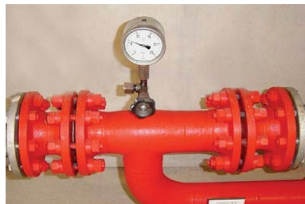
Рис. 1 — Изолирующее фланцевое соединение

Электрохимическая коррозия трубопроводов является следствием воздействия электрических токов земли, или, как их еще называют, блуждающих токов. Электрические токи проникают в трубы, которые имеют дефекты изоляции. Проникая в трубопровод, электрический ток образует катодную зону на месте проникновения, которая не опасна для системы, но на месте выхода тока образуется опасная анодная зона, которая приводит к разрушению металла в результате воздействия тока. Механизм воздействия блуждающих токов, вызванных работой контактных сетей электрифицированного транспорта, на подземно проложенный трубопровод показан на рис. 2.