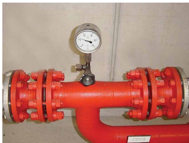
Рис. 2. Изолирующее фланцевое соединение