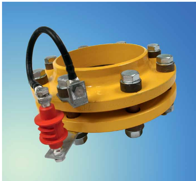
Рис. 4. Пример шунтирования изолирующего фланцевого соединения с помощью разделительного искрового разрядника EXFS 100

Разрядники EXFS 100... имеют взрывозащищенное исполнение и могут использоваться во взрывоопасных зонах класса 1 согласно ГОСТ Р 51330.9-99. Пропускная способность по току молнии равна 100 кА (10/350 мкс), что соответствует классу H согласно [2], т.е. максимально тяжелому режиму работы. Выдерживаемое напряжение промышленной частоты составляет 250 В, а номинальное импульсное пробивное напряжение – 1250 В. Разрядник EXFS 100 имеет стандартное исполнение для применения на наземных участках трубопроводов. Для удобства его монтажа предлагаются плоские и угловые крепежные скобы из оцинкованной стали с различными диаметрами отверстий под шпильку фланцевого соединения, а также, медные соединительные проводники длиной 100, 200 или 300 мм в комплекте с кабельными наконечниками. Разрядник EXFS 100 KU более универсален и может применяться как для наземного, так и подземного монтажа за счет специальной водонепроницаемой оболочки. В состав конструкции входят также два соединительных проводника длиной 2 м и сечением 25 мм 2 . При необходимости длина проводников может быть уменьшена, что позволяет осуществлять монтаж разрядников на фланцевые соединения различных габаритов. Пример установки разделительного искрового разрядника EXFS 100 на ИФС показан на рис. 4.